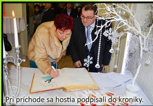
Pri príchode sa hostia podpísali do kroniky.