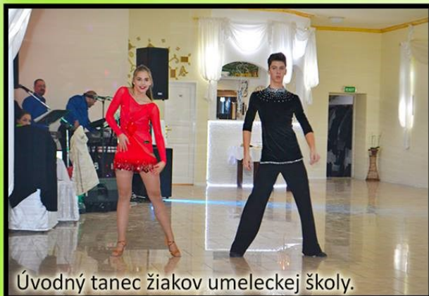
Úvodný tanec žiakov umeleckej školy.