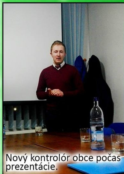
Nový kontrolór obce počas prezentácie.