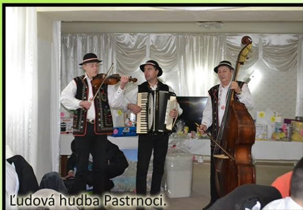
Ľudová hudba Pastrnoci.