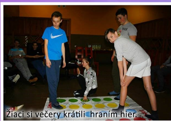
Žiaci si večery krátili hraním hier.