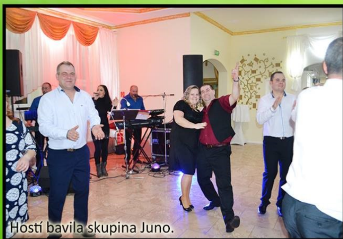
Hostí bavila skupina Juno.