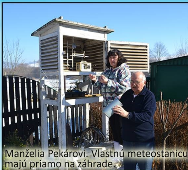
Manželia Pekárovi. Vlastnú meteostanicu majú priamo na záhrade.