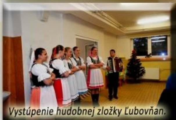
Vystúpenie hudobnej zložky Ľubovňan.