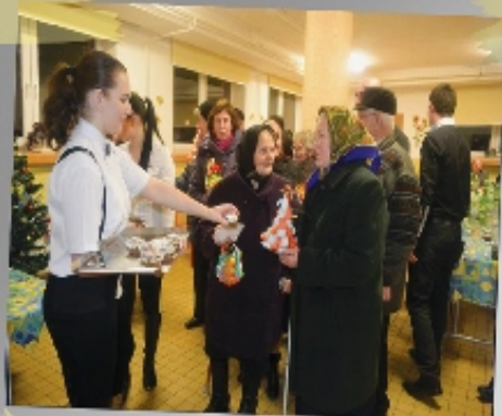
Darujte Vianoce »8-9