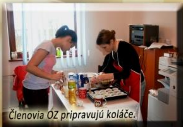
Členovia OZ pripravujú koláče.