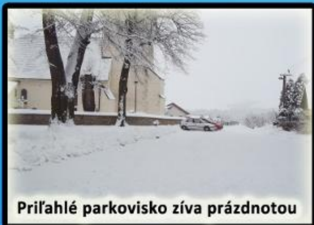
Príľahlé parkovisko ziva prázdnou

premávke č.8/2009 Zz. § 25 ods. 1a) "Vodič nesmie zastaviť a stáť v neprehľadnej zákrute a v jej tesnej blízkosti," čo spomínaný úsek je. Za porušenie tohto zákona môžu policajti udeliť pokutu vo výške 50€. Odporúčame preto všetkým vodičom, aby svoje vozidlá parkovali výlučne na príľahlých parkoviskách a vyhli sa tak novej pokute.