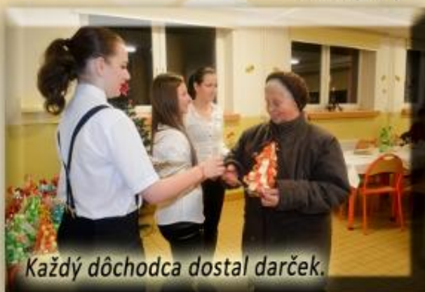
Každý dôchodca dostal darček.