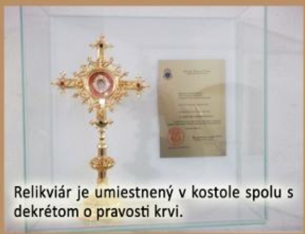
Relikviár je umiestnený v kostole spolu s dekrétom o pravosti krvi.