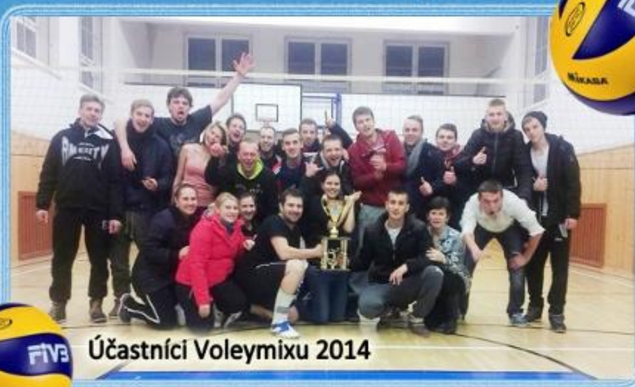
Účastníci Voleymixu 2014