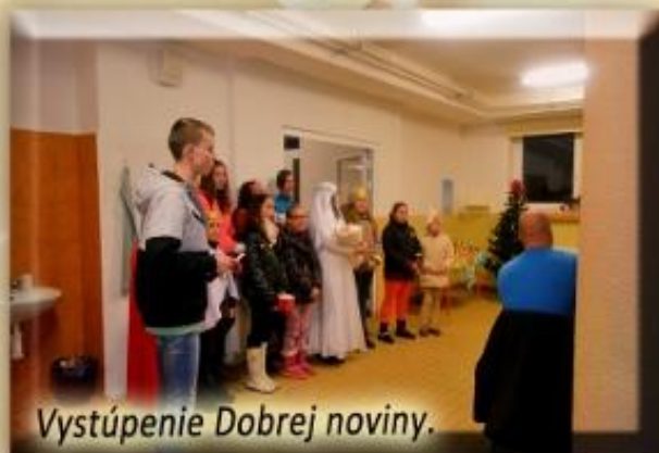
Vystúpenie Dobrej noviny.