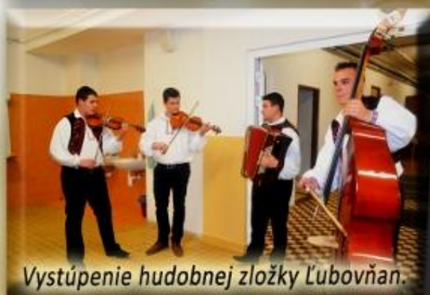
Vystúpenie hudobnej zložky Ľubovňan.

TENTO PROJEKT SA REALIZOVAL V RÁMCI PROGRAMU DARUJTE VIANOCE