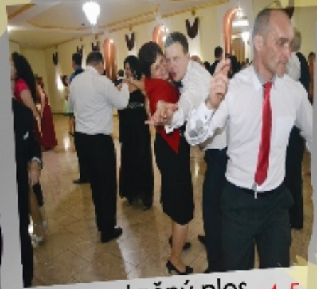
Reprezentačný ples »4-5