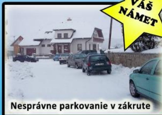
Nesprávne parkovanie v zákrute

Na základe Vášho námetu, v ktorom ste sa sťažovali na parkovanie okolo kostola, sme sa venovali aj tomuto problému. Pre všetkých, ktorí prichádzajú do kostola na aute sú k dispozícii parkoviská, ktoré sa nachádzajú v jeho tesnej blízkosti. Z fotografie je zrejmé, že niektorí vodiči aj napriek tomu parkujú na zlých miestach, a to v zákrute, ktorá spája Popradskú a Záborského ulicu. Podľa zákona o cestnej