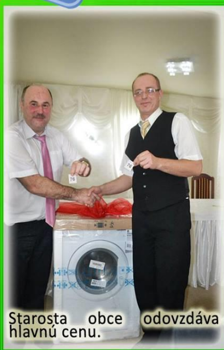
Starosta obce odovzdáva hlavnú cenu.