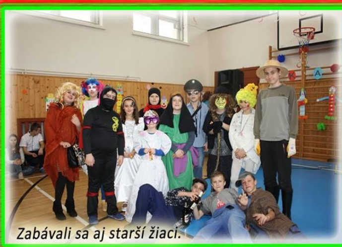
Zabávali sa aj starší žiaci.