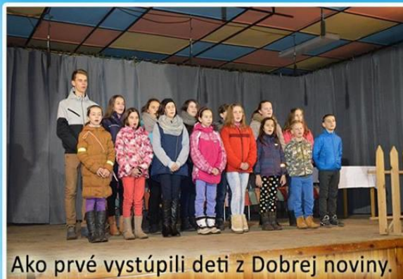
Ako prvé vystúpili deti z Dobrej noviny.

V sobotu 19. decembra pripravili členovia OZ Džatky pre všetko charitatívnu akciu s názvom Otvorme svoje srdcia . Počas dvoch hodín prinášali nielen obyvatelia obce Plaveč, ale aj okolitých dedín, darčeky v podobe hračiek, oblečenia, školských potrieb. Za ich štedrosť boli obdarovaní svietnikom v tvare srdca. Pre všetkých darcov pripravili členovia združenia občerstvenie a kultúrny program, v ktorom sa predstavili deti z Dobrej noviny, folklórne súbory Kalina a Plavčanka a v závere sa predstavil FS Staroľubovňan. Všetky dary odovzdali členovia združenia deťom v detskom domove ráno na Štedrý deň, a taktiež aj vybraným rodinám z obce Plaveč.