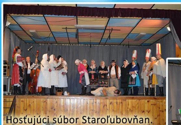
Hostujúci súbor Staroľubovňan.