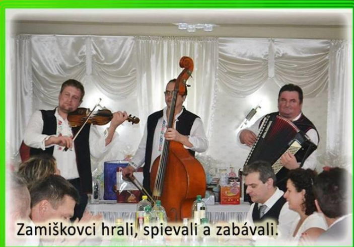
Zamiškovci hrali, spievali a zabávali.