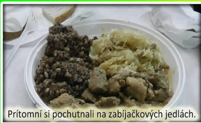
Prítomní si pochutnali na zabíjačkových jedlách.