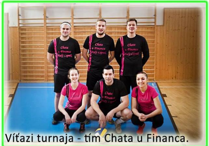
Víťazi turnaja - tím Chata u Financa.

(TEXT: P.Š, Zdroj: korzar.sk, Foto: Henrich Šalamon)