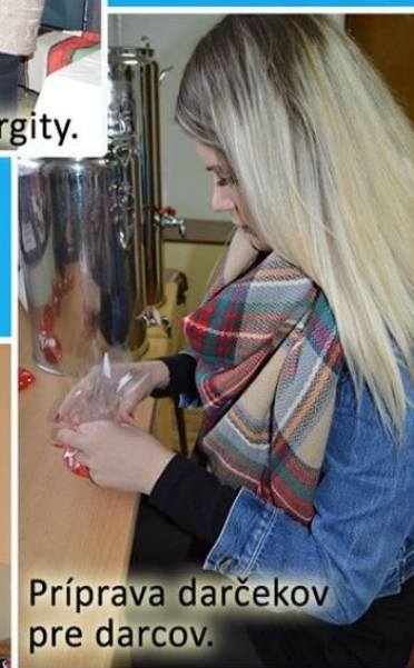
Príprava darčiekov pre darcov.