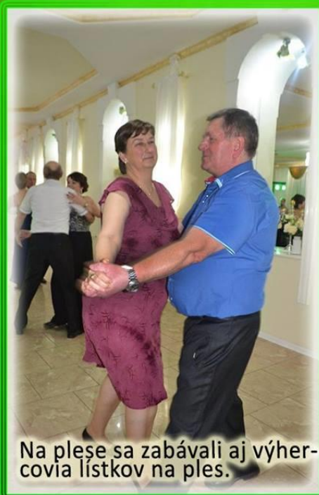
Na plese sa zabávali aj výhercovia lístkov na ples.