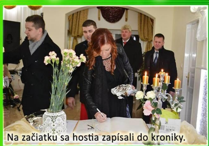
Na začiatku sa hostia zapísali do kroniky.