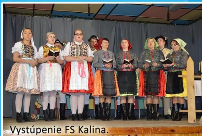
Vystúpenie FS Kalina.