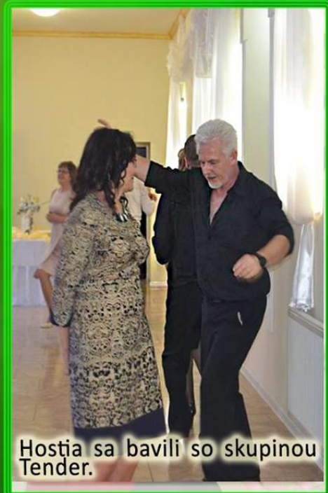
Hostia sa bavili so skupinou Tender.