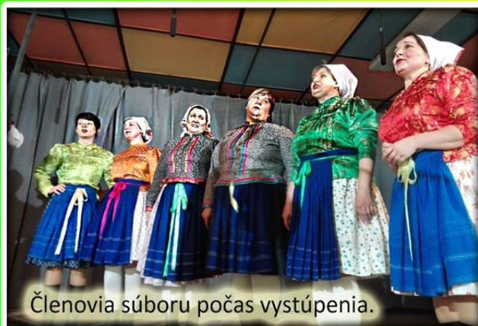
Členovia súboru počas vystúpenia.