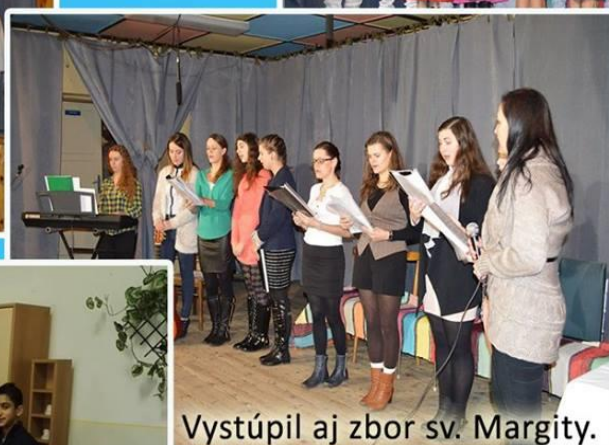
Vystúpil aj zbor sv. Margity.