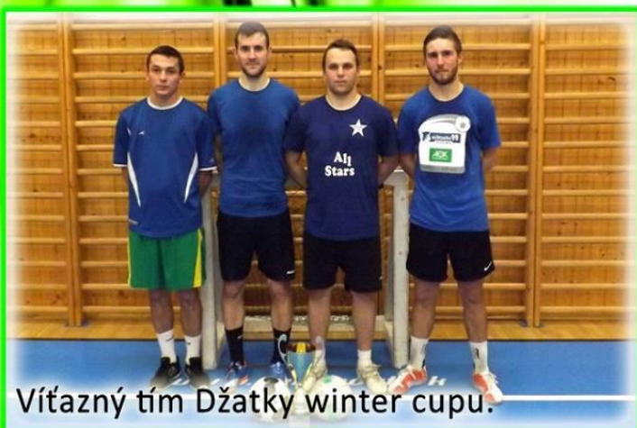
Víťazný tím Džatky winter cupu.