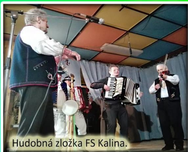
Hudobná zložka FS Kalina.