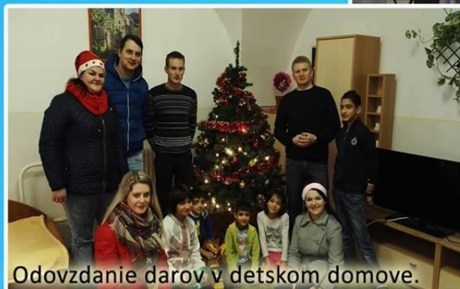
Odovzdanie darov v detskom domove.