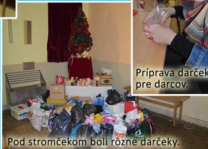
Pod stromčekom boli rôzne darčeky.