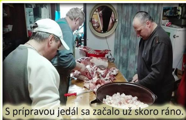
S prípravou jedál sa začalo už skoro ráno.

Fašiangy sú obdobie od Troch kráľov až do polnoci pred Popolcovou stredou. Oslavy fašiangov sa regionálne líšia, aj keď ich podstata je všade rovnaká - zábava, ku ktorej patrí dobré jedlo a pitie. Fašiangové obdobie vrcholí organizovaním rôznych kultúrnych akcií, kde sa ľudia pred príchodom pôstneho obdobia poslednýkrát zabávajú. A tak tomu bolo aj na fašiangovej zabíjačke, ktorá sa konala v sále kultúrneho