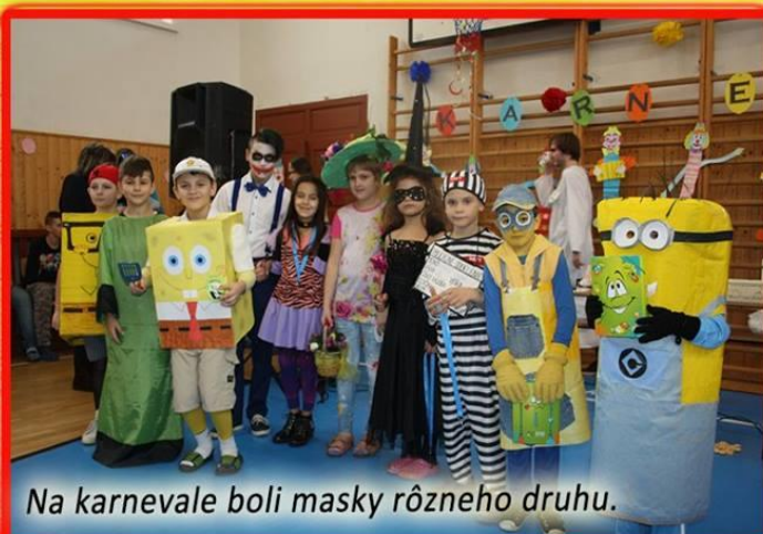
Na karnevale boli masky rôzneho druhu.

Čas veselosti a zábav sme na našej škole zavýšili karnevalom, ktorý sa konal 8. februára v priestoroch telocvične. Na chvíľu ožili rozprávkové bytosti, veci a zvieratká. Masky nás všetkých preniesli do zázračnej krajiny. O chvíle zábavy sa postaral aj animátor, ktorý si pre žiakov pripravil rôzne súťaže a aktivity. Prekvapenie si pripravili aj triedne pani učiteľky, ktoré vytvorili spoločnú skupinovú masku. Tie najlepšie karnevalové masky boli ocenené sponzorskými darčekom a nechýbala ani bohatá tombola. (TEXT: A.K.)