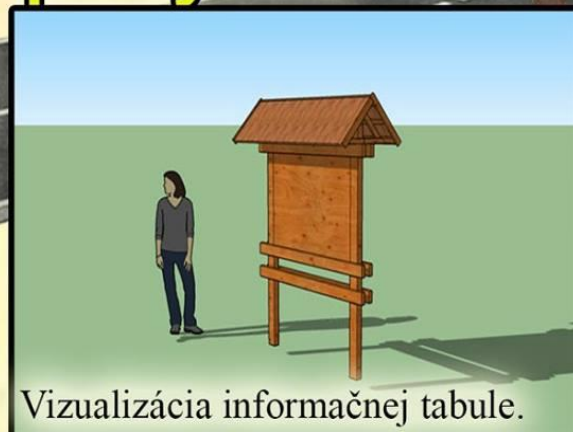
Vizualizácia informačnej tabule.

V tomto roku sa okrem pokračujúcej obnovy hradu uskutoční aj dobrovoľnícka aktivita členov OZ Džatky pre všetko, ktorou je schválený projekt s názvom "Ukážme cestu k hradu". Vďaka finančnej podpore Komunitnej nadácie Veľký Šariš, ako aj obce Plaveč a vlastného vkladu združenia, zrealizujú členovia OZ projekt v celkovej výške 1620 eur. Jeho cieľom je osadenie dvoch informačných tabulí s krátkou históriou hradu Plaveč v troch jazykoch (SK-PL-EN). Jedna tabuľa bude umiestnená priamo na hrade v blízkosti altánku a druhá dole pri lesnej ceste. Práve táto lesná cesta je zahrnutá v projekte a počíta sa s jej prečistením, úpravou a osadením lávky cez lesný potok, ktorý kríži túto cestu na hrad. Taktiež budú osadené smerové tabule, ktoré budú navigovať turistov, ako sa dostanú k hradu, či už autom, alebo pešo. Ukončenie projektu bude spojené so symbolickým otvorením letnej turistickej sezóny na hrade Plaveč, a to v sobotu 28.5.2016 popoludní.