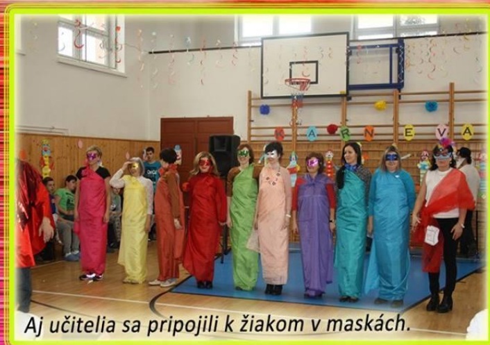
Aj učiteľia sa pripojili k žiakom v maskách.