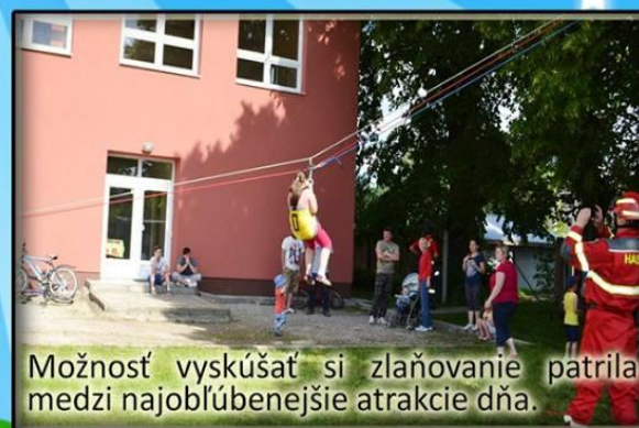
Možnosť vyskúšať si zlaňovanie patrila medzi najobľúbenejšie atrakcie dňa.