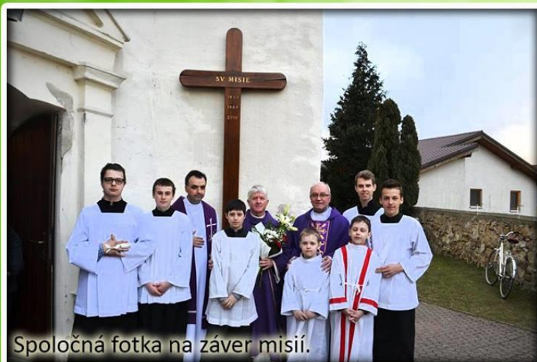
Spoločná fotka na záver misií.