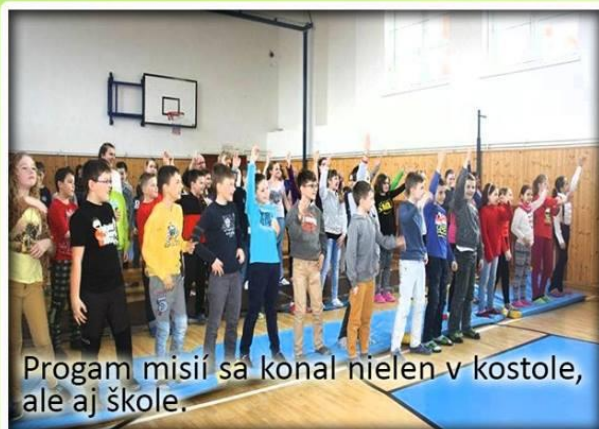
Program misií sa konal nielen v kostole, ale aj škole.