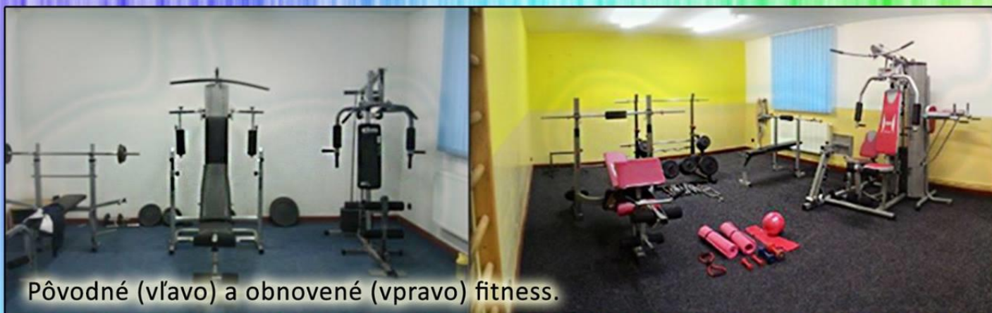
Pôvodné (vľavo) a obnovené (vpravo) fitness.