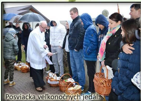
Posviacka veľkonočných jedál.