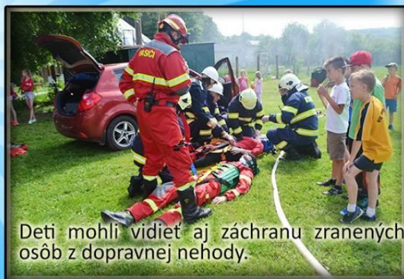
Deti mohli vidieť aj záchranu zranených ôsob z dopravnej nehody.