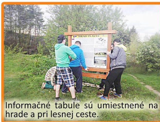
Informačné tabule sú umiestnené na hrade a pri lesnej ceste.