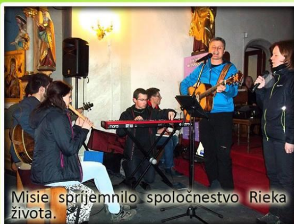
Misie spríjemnilo spoločenstvo Rieka života.