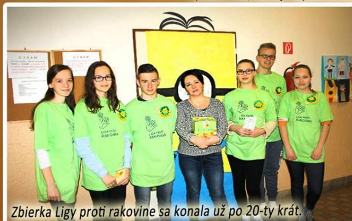
Zbierka Ligy proti rakovine sa konala už po 20-ty krát.