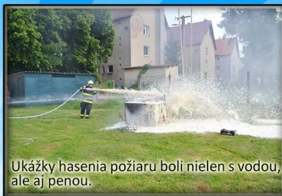
Ukážky hasenia požiaru boli nielen s vodou, ale aj penou.