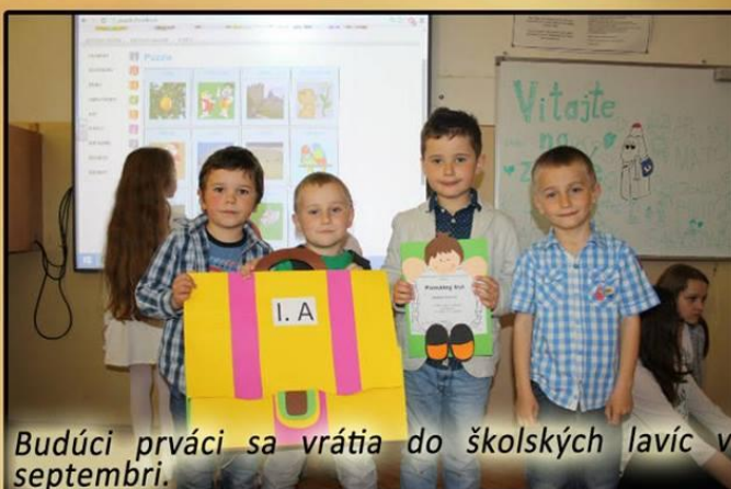
Budúci prváci sa vrátia do školských lavíc v septembri.