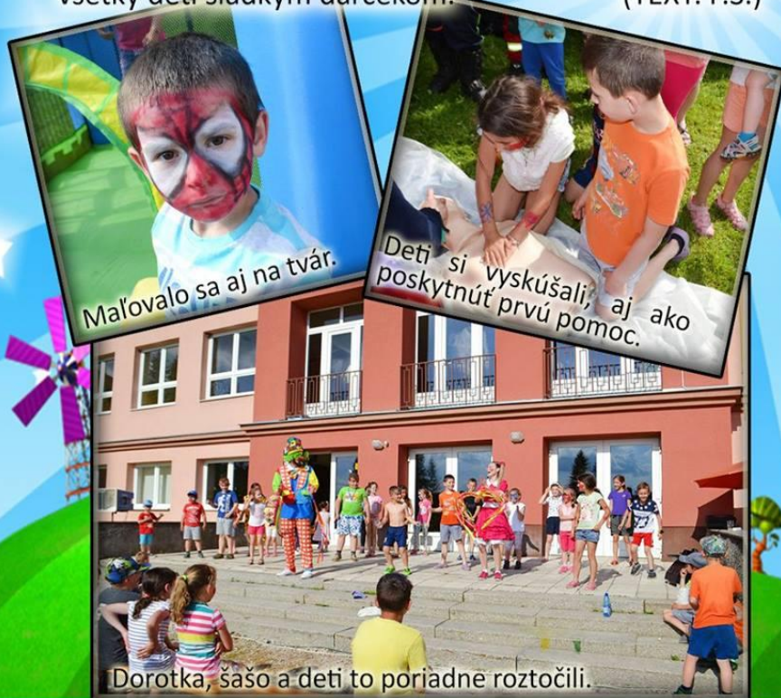
Maľovalo sa aj na tvár.