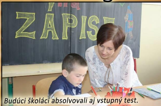
Budúci školáci absolvovali aj vstupný test.