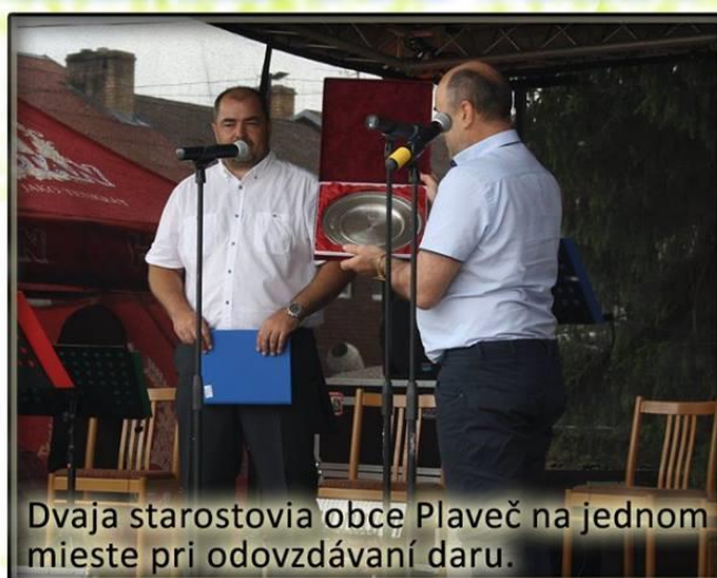
Dvaja starostovia obce Plaveč na jednom mieste pri odovzdávaní daru.