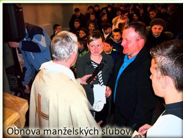
Obnova manželských sľubov.