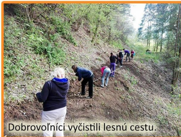
Dobrovoľníci vyčistili lesnú cestu.