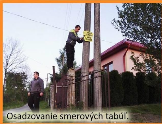
Osadzovanie smerových tabúľ.