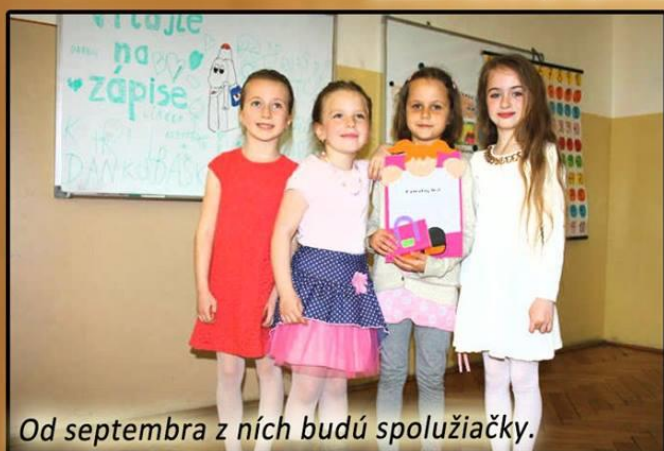
Od septembra z nich budú spolužiačky.