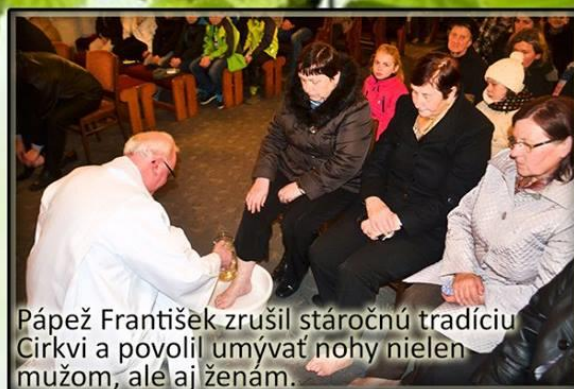
Pápež František zrušil stáročnú tradíciu Cirkvi a povolil umývať nohy nielen mužom, ale aj ženám.