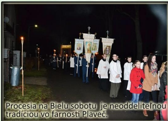
Procesia na Bielu sobotu je neoddeliteľnou tradíciou vo farnosti Plaveč.