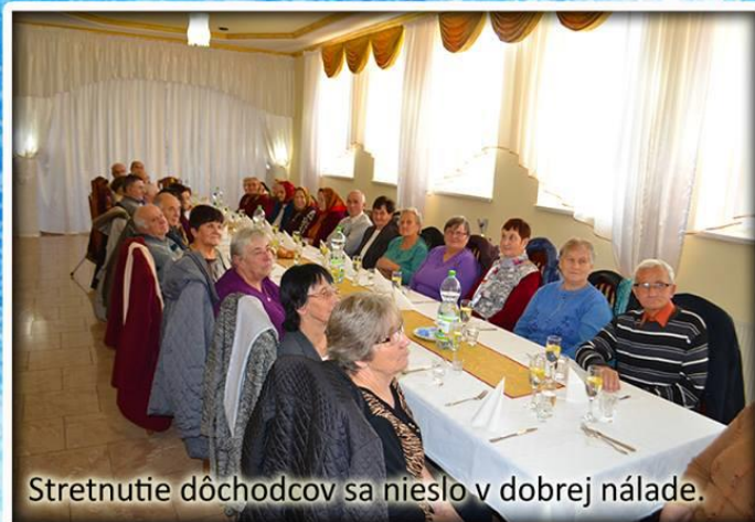
Stretnutie dôchodcov sa nieslo v dobrej nálade.