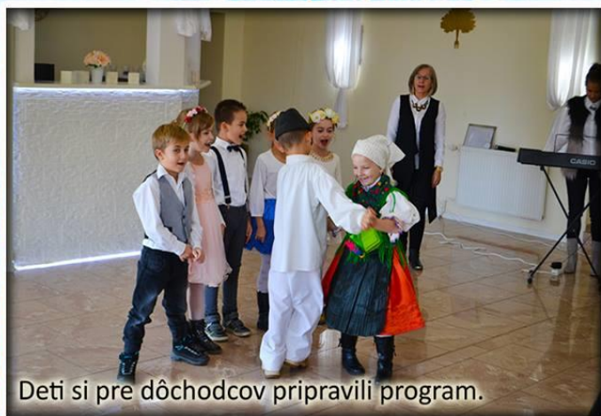
Deti si pre dôchodcov pripravili program.