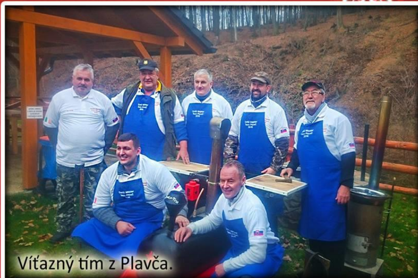
Vítazný tím z Plavča.