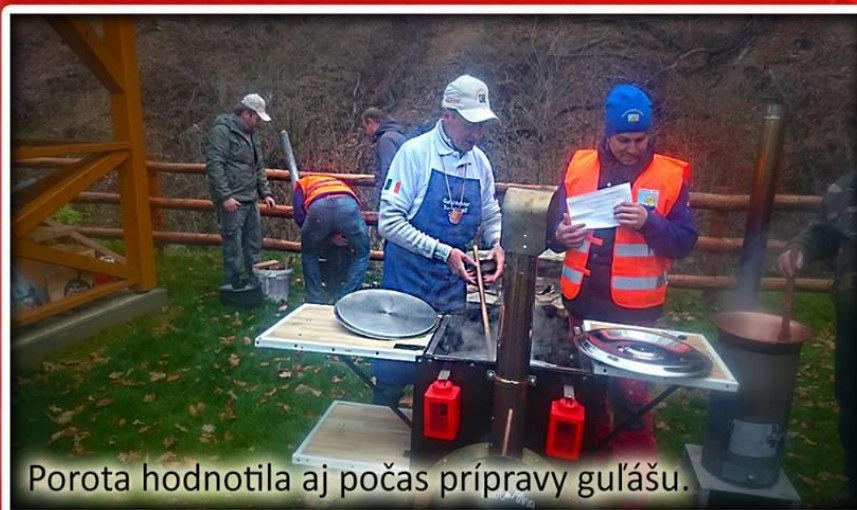
Porota hodnotila aj počas prípravy gulášu.