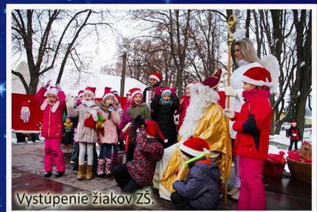
Vystúpenie žiakov ZŠ.