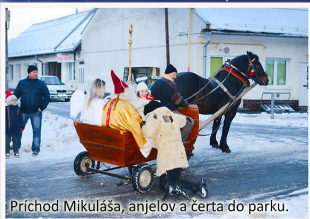
Príchod Mikuláša, anjelov a čerta do parku.