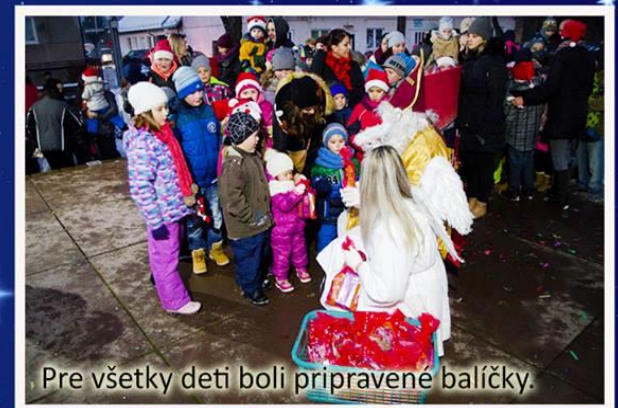
Pre všetky deti boli pripravené balíčky.