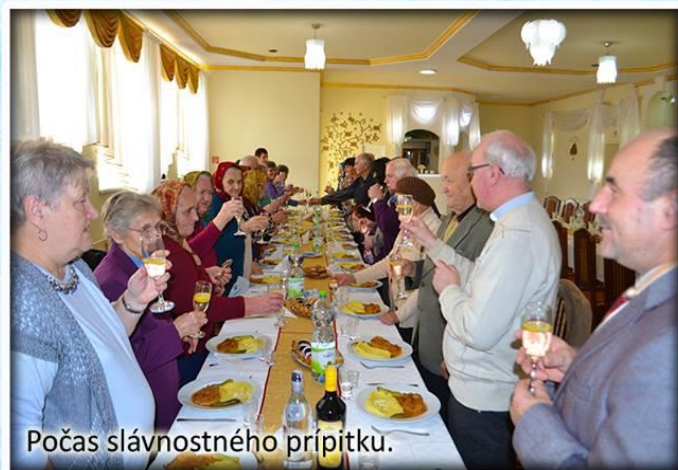
Počas slávnostného prípitku.