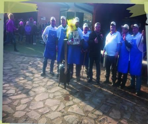
Súťaž vo varení »5