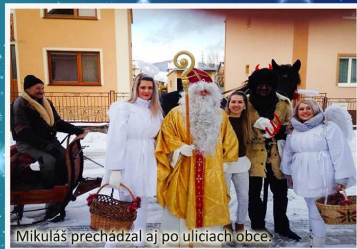
Mikuláš prechádzal aj po uliciach obce.