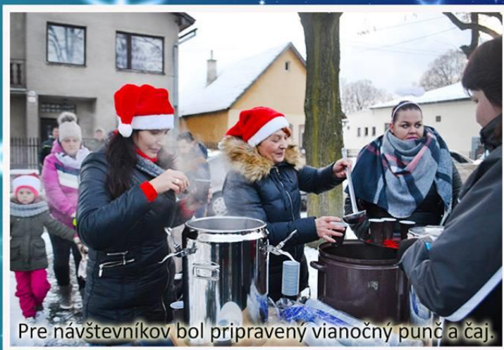
Pre návštevníkov bol pripravený vianočný punč a čaj.