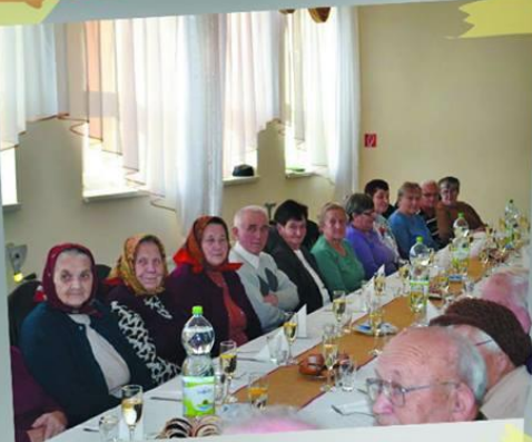
Stretnutie dôchodcov »3