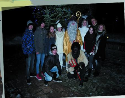
Deň s Mikulášom »6