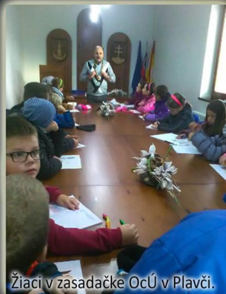
Žiaci v zasadačke OcÚ v Plavči.